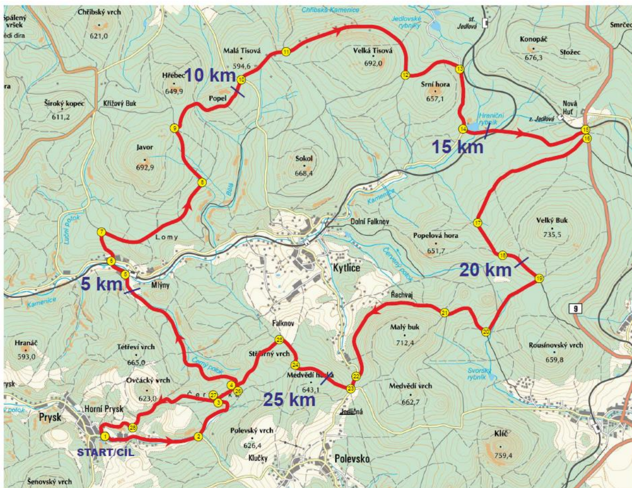
FOFR CUP - HLAVNÍ TRASA 31 Km - profil převýšení - 680 nastoupaných metrů